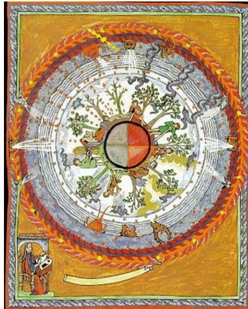
L'arbre cosmique : vision d'Hildegard Von Bingen