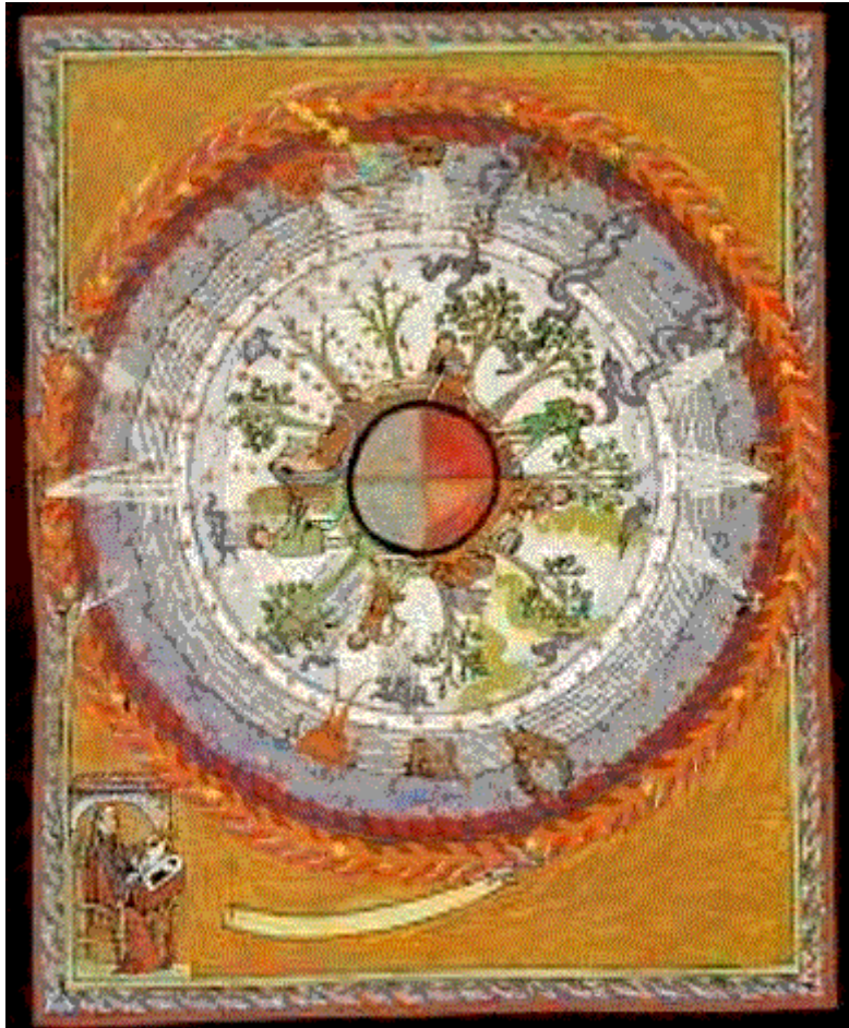
L'arbre cosmique : vision d'Hildegarde Von Bingen